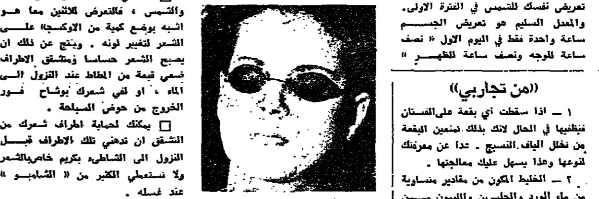
النظارة الداكنة تحمي عينيك

ذلك حساس ، فاحميها بواسطة مستحضر خاص . اكتساب اللون البرونزي الجليل بسرعة دون ان يتعرض بشرك ويشرك للشاكل قيل كل شيء ، لا تفاني في تعريض نفسك للشمس في الفترة الأولى . والمعدل السليم هو تعريض الجسم ساعة واحدة فقط في اليوم الاول « نصف ساعة للوجه ونصف ساعة للظهر »